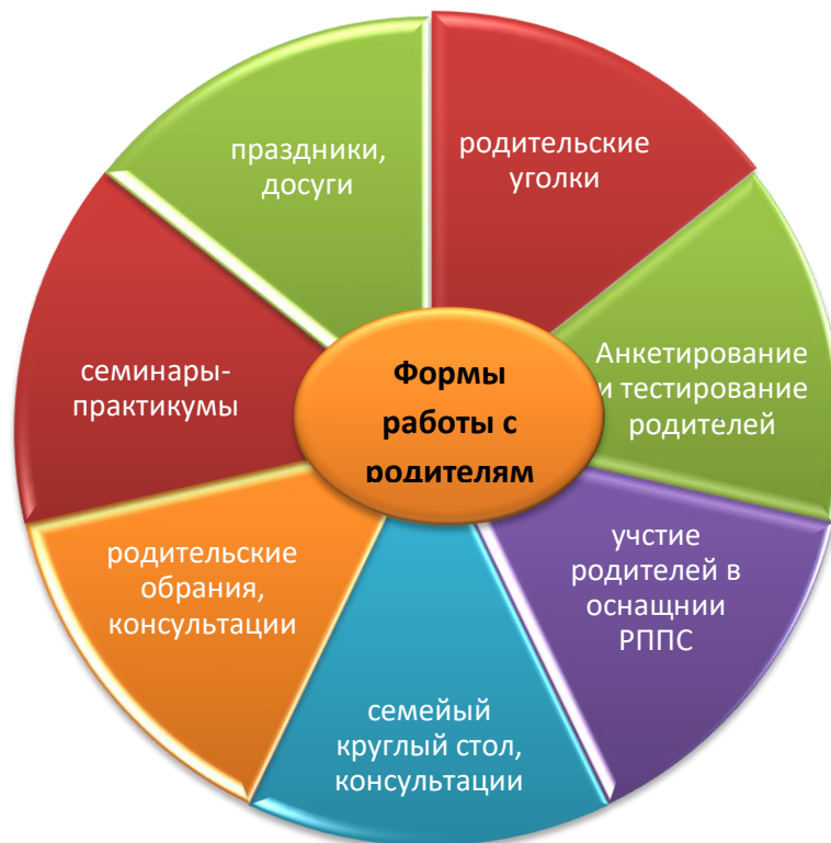
Рис. 2. Формы работы по взаимодействию с семьями воспитанников

Предусматривает привлечение родителей к созданию условий в семье, способствующих наиболее полному усвоению знаний, умений и навыков, полученных детьми на занятиях и реализации их в повседневной жизни, просветительскую работу с родителями в форме семинаров-практикумов, тренингов, консультаций